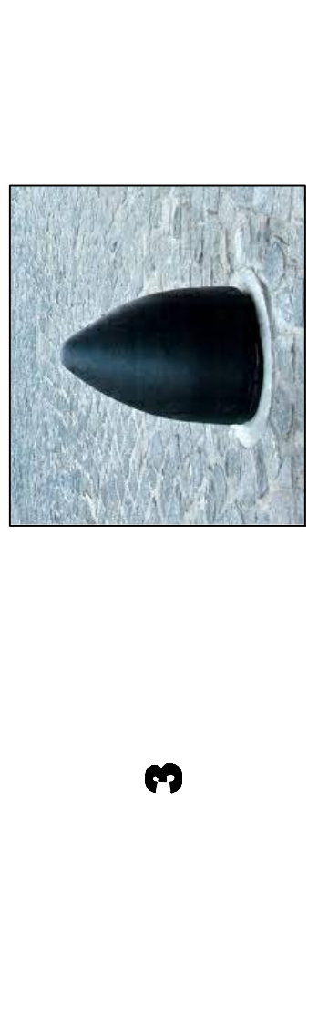
BOLARDO TIPO BALA