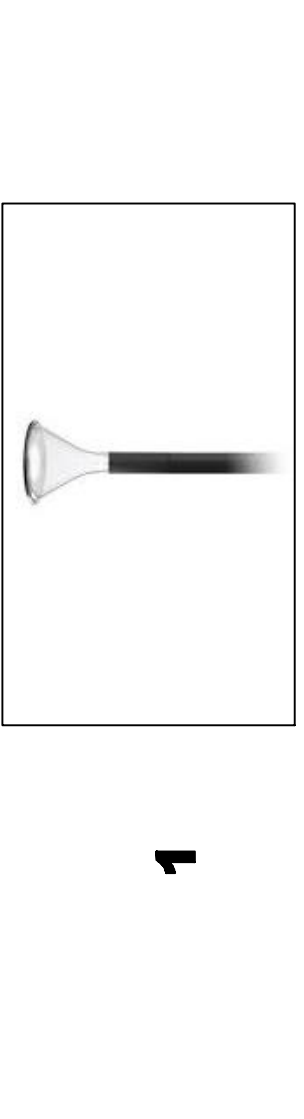
FAROLA ORNAMENTAL LED