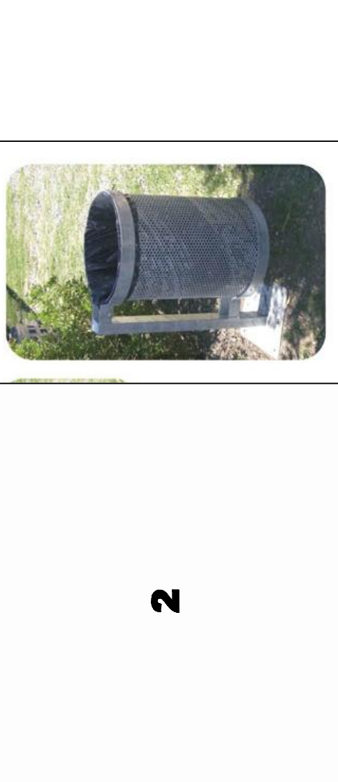
CESTOS DE BASURA